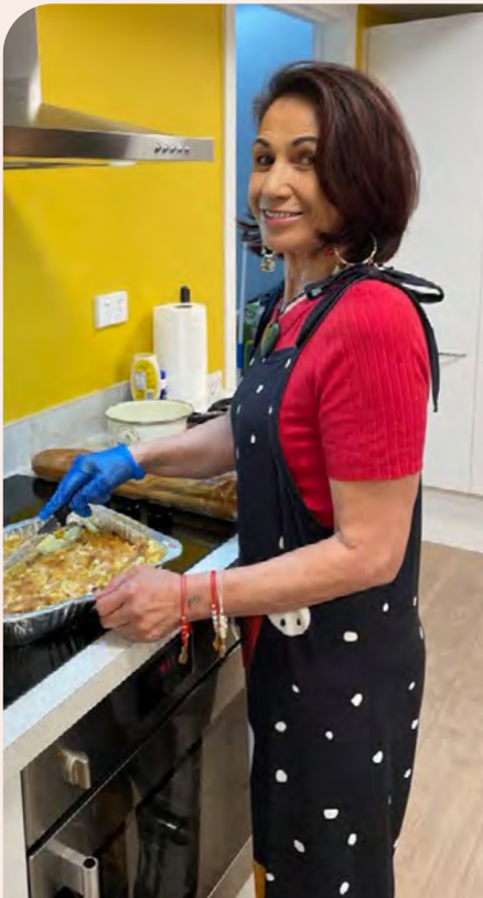
Ngāue 'a Noleen 'i he loki fakakomunitii.

'I he taimi na'e fakaava ai ha ngaahi fale 'apaatimeni 'i 'Okalani 'i he mahina 'e 18 kuohili, na'e hiki mai ai ha kakai 'e toko 110 tupu.